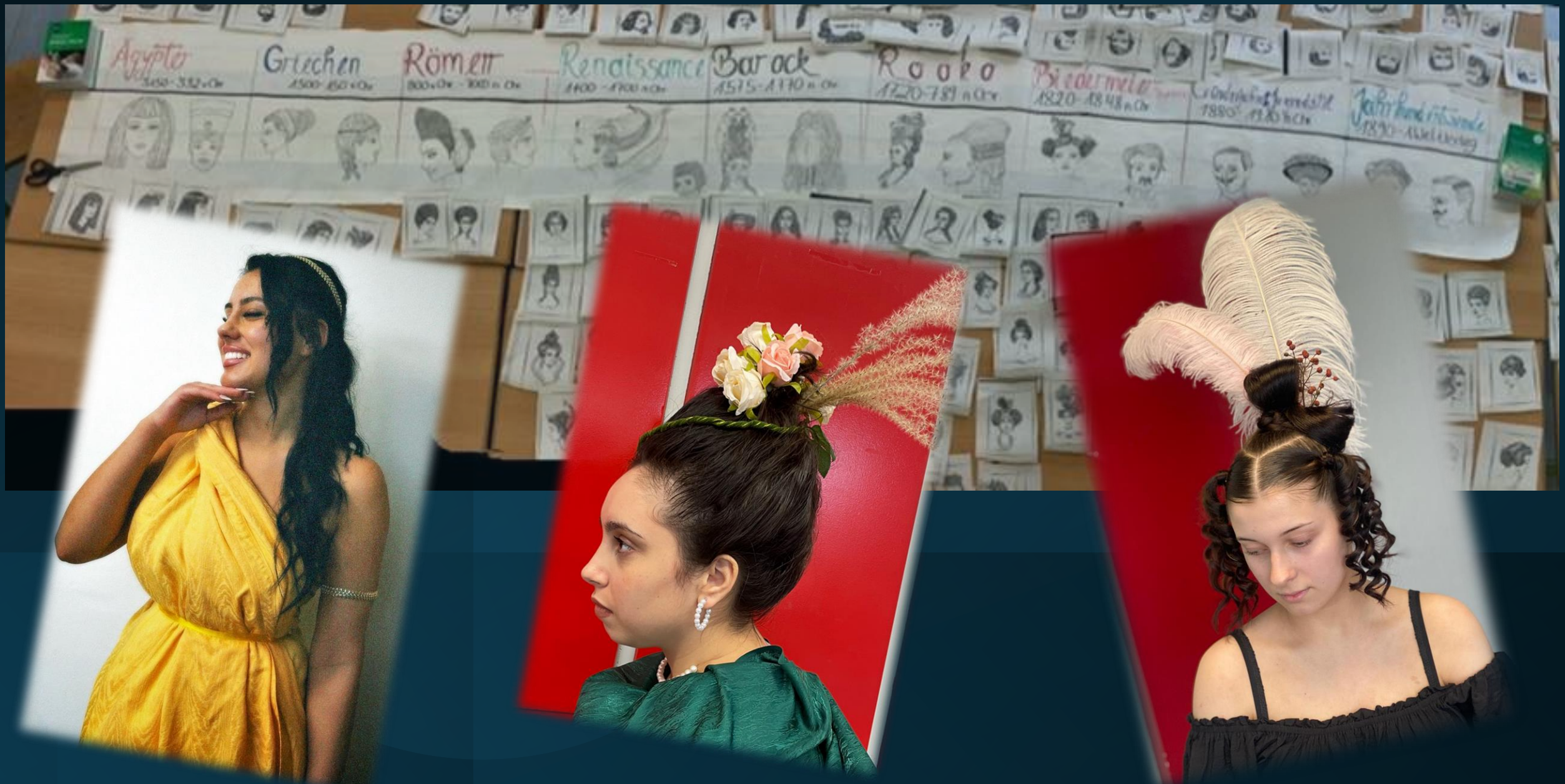
Projekt Schönheit im Wandel der Zeit Feb. 2024